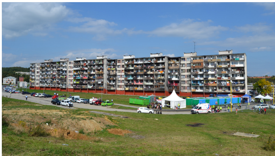
Obrázok 2. Pohľad na bytové domy na Krčméryho ulici. 14. septembra 2021.

IX novovybudovaný bytový dom Hrebendova 2A s 12 bytovými jednotkami bežného štandardu, ktorého vlastníkom je mesto Košice.