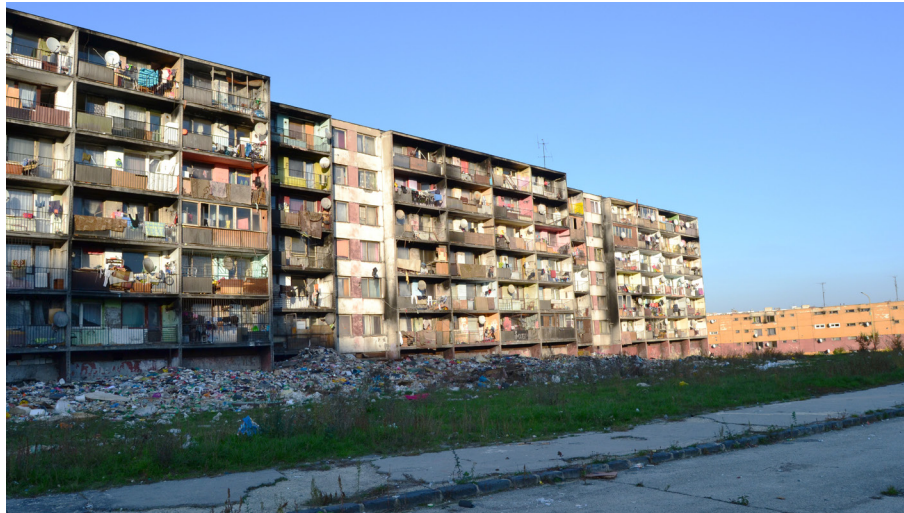
Obrázok 1. Pohľad na bytové domy na Krčméryho ulici. Foto: Klara Kohoutová, 22. októbra 2019.